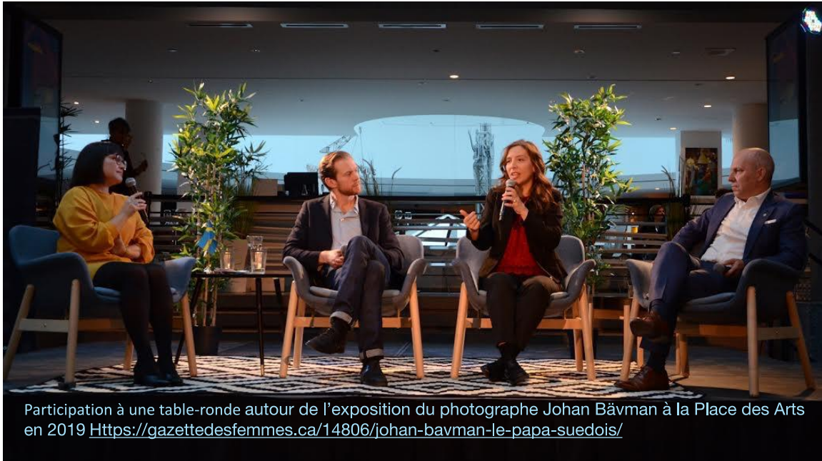
Participation à une table-ronde autour de l'exposition du photographe Johan Bävman à la Place des Arts en 2019 https://gazettedesfemmes.ca/14806/johan-bavman-le-papa-suedois/

F. R. : Ce congé qu'on appelle à tort congé de maternité est en réalité un congé parental. Il est donc offert autant aux pères qu'aux mères.